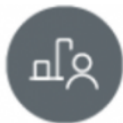
Tableau de bord apprenants